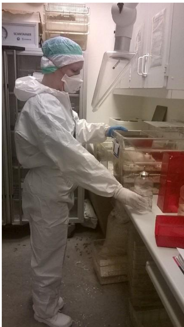
Benyt værnemidler og udsug ved kontakt med forsøgsdyr.

Selvom der er stor individuel forskel på, hvor genetisk disponerede vi er for at udvikle astma og allergi, så viser studier, at risikoen øges med øget eksponering af allergener. Den overordnede strategi er derfor at blive eksponeret mindst muligt for allergenerne. Det er de personalegrupper, som har direkte kontakt med dyrene i det daglige, der generelt er udsat for den største eksponering. Det drejer sig om dyreteknikere, laboranter og forskere. Men også dem, der tømmer og rengør bure er udsat for høj eksponering. Vejledere og laboranter, der arbejder med vævssnit mm, vil typisk være mindre eksponerede. For alle faggrupper gælder det, at reduceret eksponering forebygger astma og allergi.