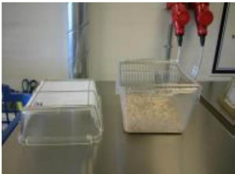
Filtertoppe kan reducere luftbårne allergener med en faktor 4 til 5.

Eksempelvis er en P2-maske velegnet, mens kirurgiske masker ikke er effektive nok. Hvis arbejdet varer i mere end to timer om dagen, er det et lovkrav, at der bruges særlige masketyper (air-stream-masker eller friskluftforsynet åndedrætsværn), da der er ekstra respirationsarbejde forbundet med at trække vejret i almindelige masker. Lokalet skal være velventileret, og husk at tænde for udsug i borde og bænke. Brug stinkskabe og LAF-bænke, når det er muligt. Sørg for at der ikke hentes flere forsøgsdyr ind i lokalet af gangen, end hvad der er brug for. Undgå at rode op i strøelsesmaterialet, når dyrene løftes op, da du ellers risikerer at hvirvle allergener op. Ved flytning af forsøgsdyr fra stald til laboratoriet og tilbage igen bør burene være dækket med filtertoppe. Efter endt håndtering skiftes tøj – dette er med til at forebygge, at dine arbejdskolleger og familie eksponeres for allergenerne. Benyt en kittel, som du kun har hængende i laboratoriet. Hav også særligt fodtøj til arbejdet eller benyt overtrækssutter. Vask altid hænderne efter endt arbejde med forsøgsdyrene. Lokalerne bør rengøres efter endt brug.